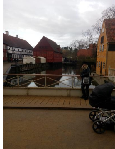
Den Gamle By – Stari grad

Naš boravak u Langkaer gimnaziji je bio fantastično iskustvo, koje će nam pomoći u daljem radu i razvoju. Želimo da se zahvalimo fondaciji Erazmus+ koja nam je omogućila da ovo putovanje i ostvarimo.