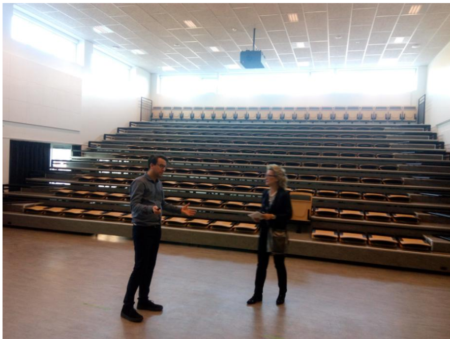
U razgovoru sa direktorom