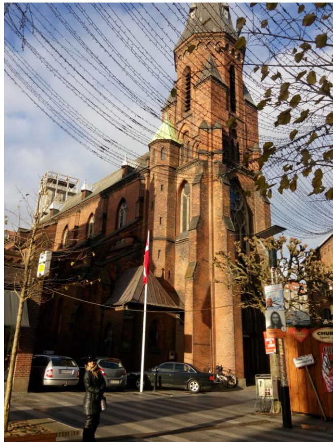
Katedrala u Arhusu

Druga i možda najvažnija kulturna znamenitost grada je tzv. Den Gamle By (Stari grad), muzej na otvorenom u kojem je prikazano kako se život u Arhusu razvijao kroz XIX, pa do 60-ih godina XX veka, kako u životu običnih ljudi, tako i u životu zanatlija i privrede. Poseta ovim lokalitetima je bila predivno iskustvo koje je zaokružilo naš boravak u Arhusu.